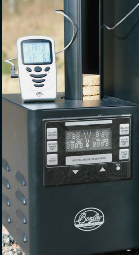
Den digitala rökgeneratoren ansluts till ett jordat 220 volts eluttag och rök-briketterna fylls på i rörmagasinet.