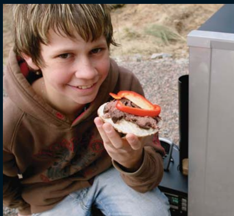
Slutresultatet var magnifikt och drar grannar från långt avstånd!

Nu kan alla jägare röka sitt eget viltkött, med Bradley Smoker behöver man inte flera års erfarenhet och handlag, samt passning en hel dag. Utan överdrift kan man påstå att den kanadensiska rökugnen Bradley Smoker presenterat sig som den nya generationens rök.