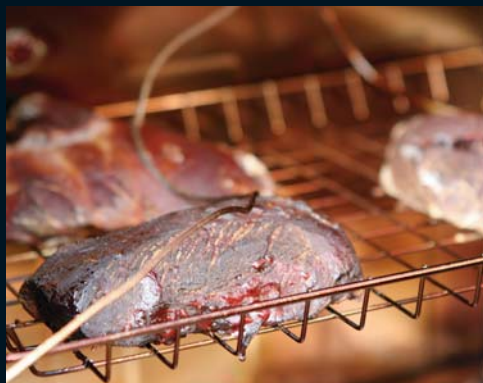
Med enkel inställning av både tid och temperatur har du full kontroll över köttet under röktiden.